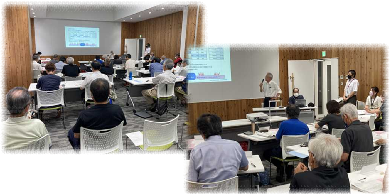
< 審査会の様子 >

採択された事業が実施されることにより、新城地域自治区内の課題解決や活性化、また、今後の地域活動の活発化につながっていくことを期待したいと思います。