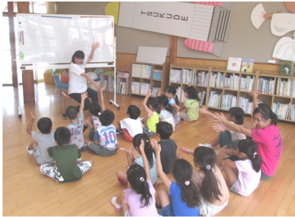
こども園での英語遊び

作手こども園では、平成28年度から始めた3歳以上の園児を対象に英語に親しむ機会づくり(英語遊び)を継続します。