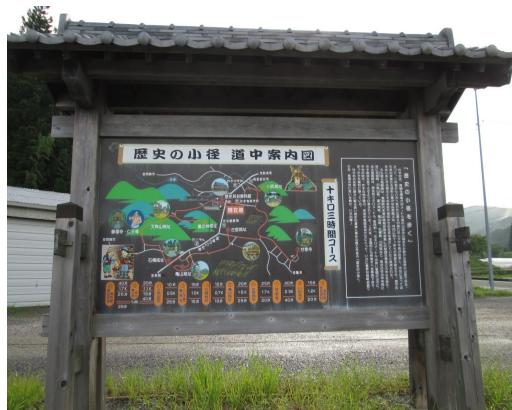
作手総合支所前の更新看板

来年度は、作手総合支所前、甘泉寺駐車場、手作り村駐車場に設置してある歴史の小径道中案内看板の更新、屋根瓦の一部修繕を行います。