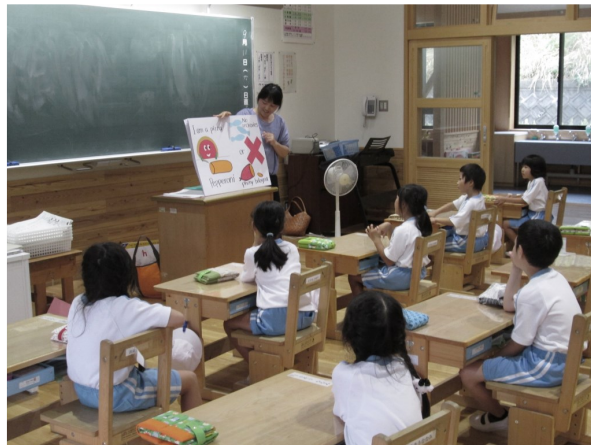
小学校での英語遊び

また、来年度から本格実施される3、4年生の外国語活動及び5、6年生の外国語(英語)の教科化に向け、教員を支援するアドバイザーを派遣し、指導方法について共に考えていきます。