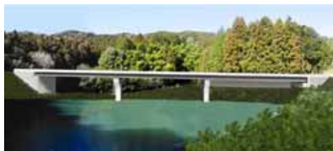
川上橋完成予想図

八束穂地区: 6月より文化財調査(モリ下遺跡)を実施しています。 10月17日(土)に遺跡説明会を予定しています(詳しくは下記をご覧ください)。