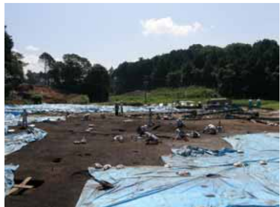
モリ下遺跡の発掘調査状況

当日は、専門家から直接詳しい説明が聞けるチャンスですので、歴史に興味がある方や地元の皆様など、気軽にお越しいただければと思います。