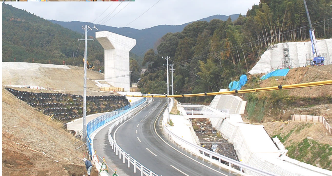
写真:牛倉地区の大宮川橋付近の工事状況を1年前と比較してみました。大宮川、県道の付け替えが終了して、現在は、大宮側東側の橋脚工事を実施しております。