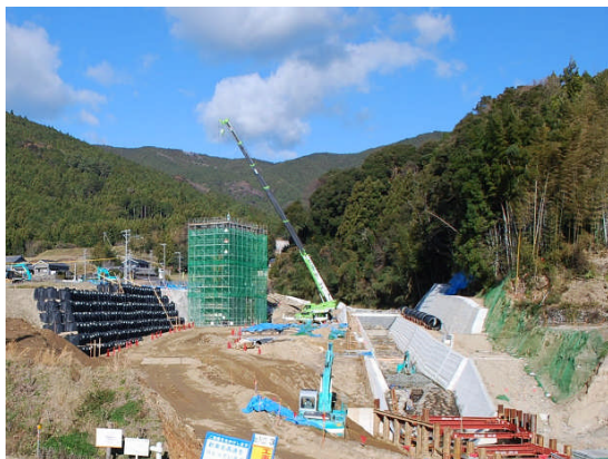
←昨年 12 月の大宮川

内容 ~ 1. はじめに 2. いちねんを振り返って 3. 石座神社遺跡の見学会を実施いたしました