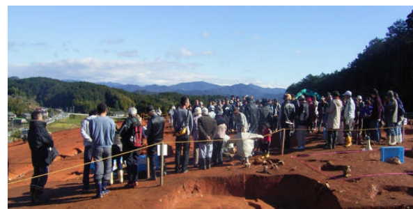
石座神社の現地見学会の様子

石座神社の周辺は、邪馬台国の時代に豪族の館があったようで、銅鏡などかなり貴重な遺構が見つかりました。特に、豪族の館の跡地は愛知県で初めての発見だそうです。