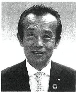
全国市議会議長会会長・ 横浜市議会議長