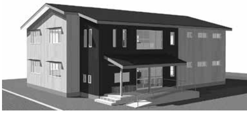
千郷児童クラブ 完成イメージ図