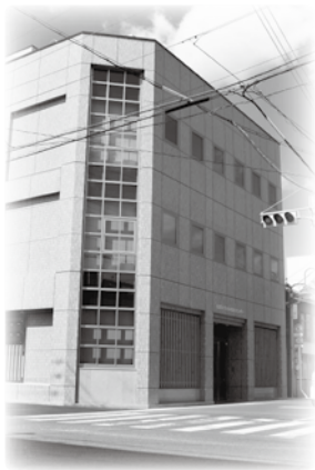
まちなみ情報センター

若者や市民が集まる整備に加え、市内で活躍する若手企業者や市民活動団体の商品販売スペース、奥三河観光への情報拠点をつくります。