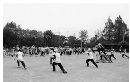
つくしんぼうスポレク祭

「スポーツ教室」「こどもスポーツクラブ」など気軽に楽しみながら学べる機会を提供した