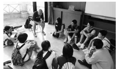
イングリッシュキャンプ

通常事業の時間帯で小中連携の英語授業研修を行ってきた。 また、「イングリッシュチャレンジ」「イングリッシュキャン」を通じて、2年後に市内で開催のニューキヤッスルアライアンスに向け、児童・生徒や教師の英語学習へモチベーションを高めたい。