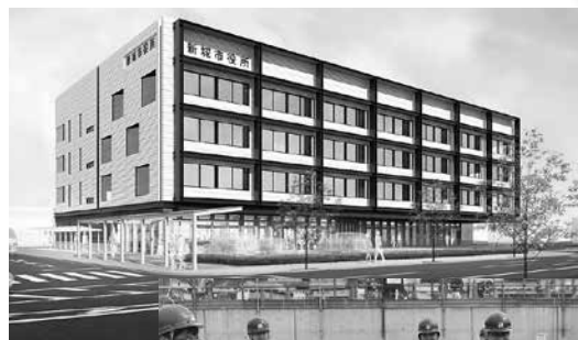
新庁舎完成イメージ図

地方自治法の一部改正に伴い、個人市民税における住宅借入金特別税額控除について、適用期限を延長するため必要である。