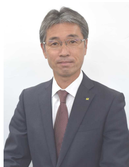
新城市長 下江 洋行

市職員の仕事は、すべて市民の幸せを願って行われます。その仕事で給与を受け取り、生活を支えます。ですから市民のため、地域のために骨を折ってみたいと思う人にとっては、うってつけの仕事です。