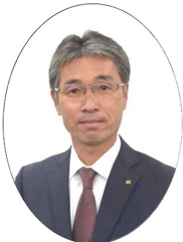
新城市長 下江 洋行