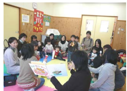
親子ふれあい広場

“三つ子の魂100まで”と言われるように、基礎的な生活習慣や愛情、信頼感を身につける時期です。親と子、地域と子どもなどのふれあいに重点をおき、保護者向けに学習・交流の機会を提供し、家庭の教育力の向上を図ります。