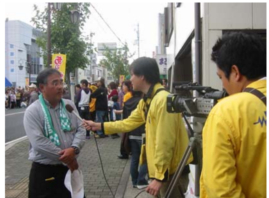
ケーブルテレビ撮影状況

そのために、行政・民間・各種団体等の広範囲にわたる学習情報を体系的に収集する体制を整え、この情報を広報紙・市ホームページ・ケーブルテレビなどの媒体を有効に活用し、生涯学習情報の提供を図ります。