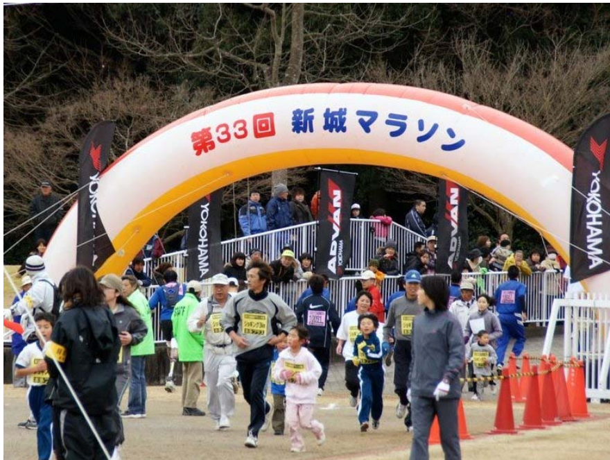
新城マラソン大会

技術やルールが比較的簡単で、子どもから高齢者まで年齢や体力に関係なく、だれでも・どこでも・いつでも気軽に楽しめることを目的として、新しく考案されたり、紹介されたりしたスポーツ。その数は、数百種類以上あるといわれている。（例：バウンドテニス、ペタンク、グラウンドゴルフ等）