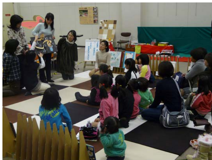
読み聞かせボランティア

各種講座の修了者や地域で活動しているグループ、サークルなどの相談に応じ、助言するとともに活動の場の提供に努め、団体の育成・支援を図ります。