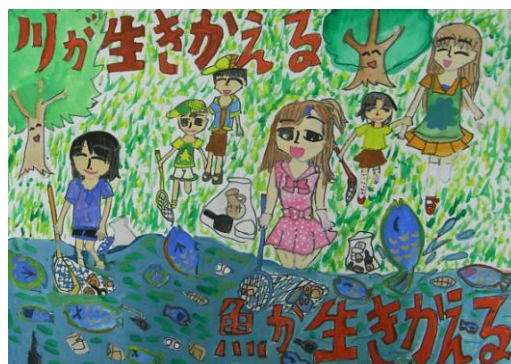
平成20年度金賞作品