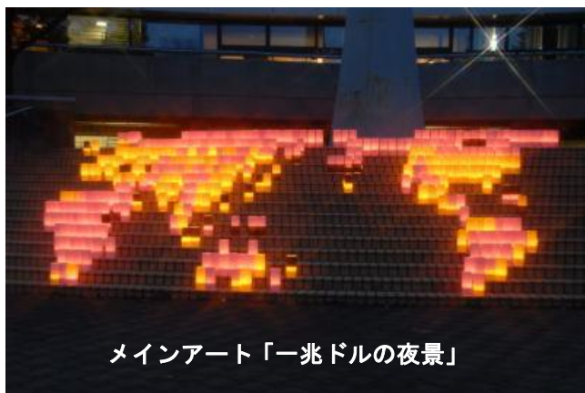
メインアート「一兆ドルの夜景」