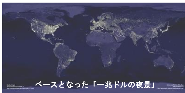
ベースとなった「一兆ドルの夜景」