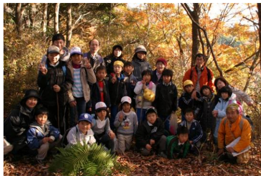
森の学校「山ざる教室」

郷土の自然について調査、展示、教育普及、資料収集するといった、さまざまな博物館活動を市民ボランティアとともに力をあわせて推進しています。