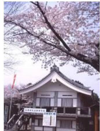
長篠城址史跡保存館