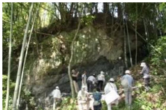
ガイドツアーの様子