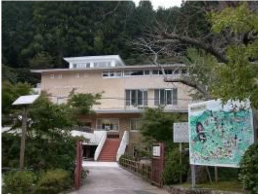
鳳来寺山自然科学博物館

また、県内最大規模の植物標本を収蔵するなど、自然資料の収集保存活動も行っています。