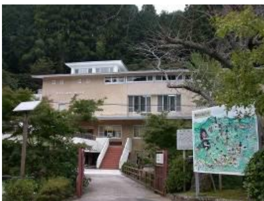
鳳来寺山自然科学博物館

また、県内最大規模の植物標本を収蔵するなど、自然資料の収集保存活動も行っています。