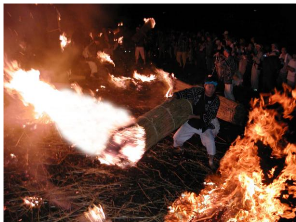
県指定文化財 信玄原の火おんどり【無形民俗】