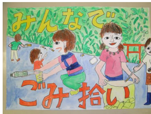
平成21年度金賞作品