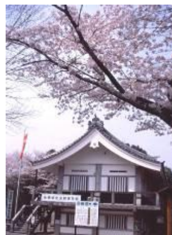
長篠城址史跡保存館