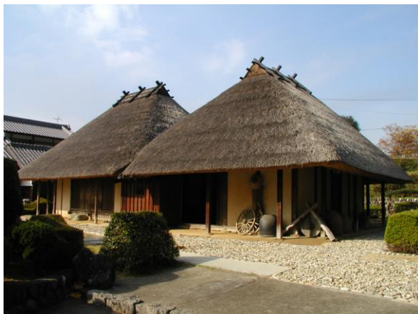
国指定文化財 望月家住宅【建造物】