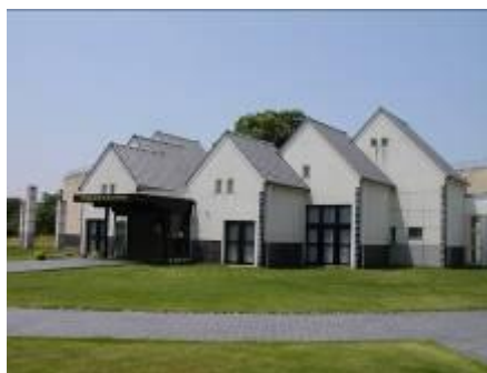
設楽原歴史資料館

また、設楽原歴史資料館には、日本開国の基となった幕末の日米修好通商条約調印の立役者・岩瀬忠震についての資料も展示しています。