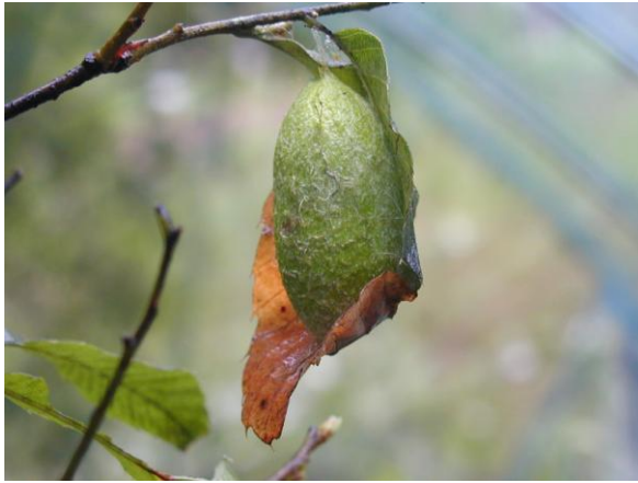
出沢やままゆ養蚕所