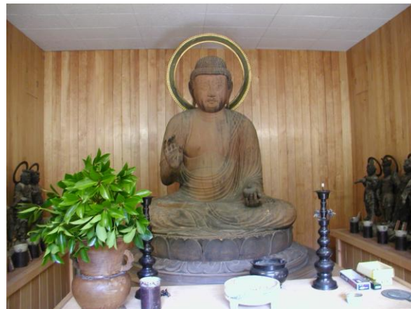
国指定文化財 木造薬師如来坐像【彫刻】