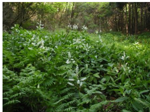
市指定文化財 ミカワバイケイソウ自生地【天然記念物】