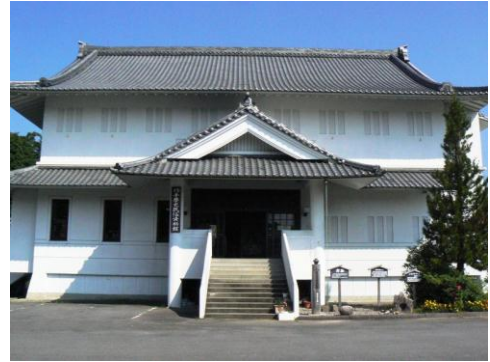
作手歴史民俗資料館

作手歴史民俗資料館には、こうした風土の中で育まれた人々の歴史、民俗や湿地についての資料が集められています。