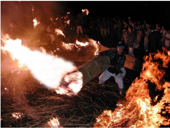
県指定文化財 信玄原の火おんどり【無形民俗】