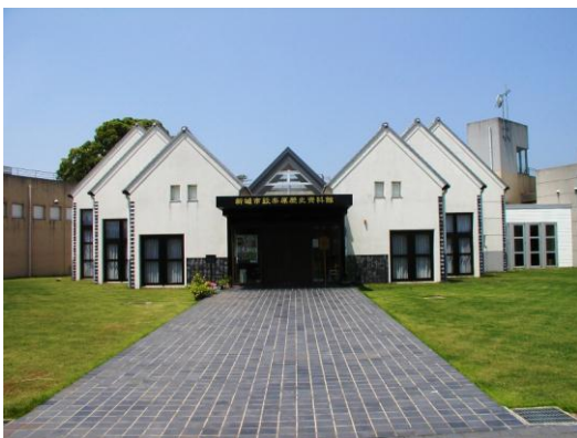
設楽原歴史資料館

また、設楽原歴史資料館には、日本開国の基となった幕末の日米修好通商条約調印の立役者・岩瀬忠震についての資料も展示しています。