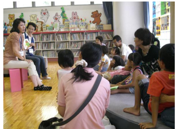
二ヶ国語絵本読み聞かせ