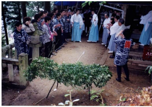
県指定文化財 設楽のしかうち行事【無形民俗】