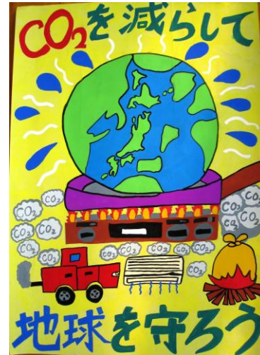
平成24年度金賞作品