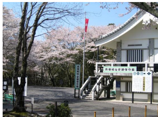
長篠城址史跡保存館