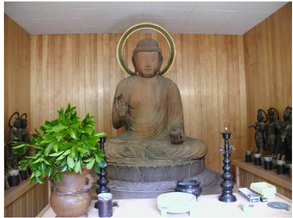
国指定文化財 木造薬師如来坐像【彫刻】