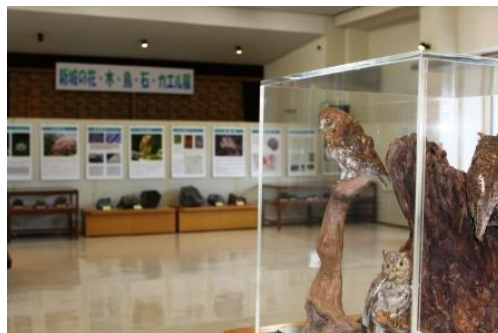
「新城の花・木・鳥・石・カエル」展

郷土の自然について調査、展示、教育普及、資料収集するといった、さまざまな博物館活動を市民ボランティアとともに力をあわせて推進しています。