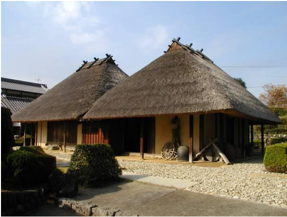
国指定文化財 望月家住宅【建造物】