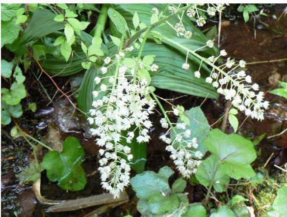
市指定文化財 ミカワバイケイソウ自生地【天然記念物】