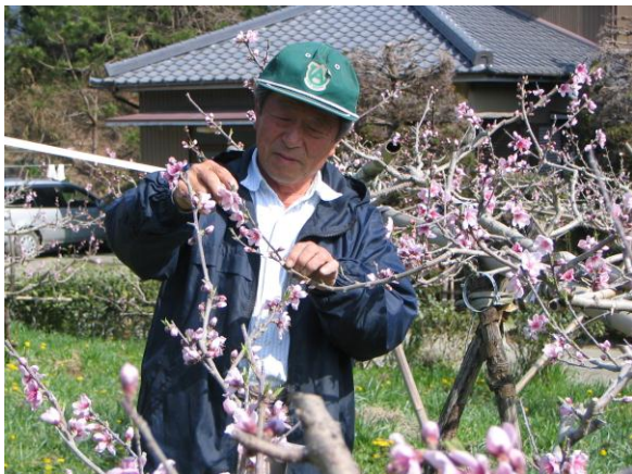
エコファーム河部自然農園