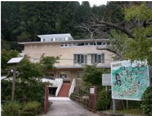
鳳来寺山自然科学博物館

また、県内最大規模の植物標本を収蔵するなど、自然資料の収集保存活動も行っています。