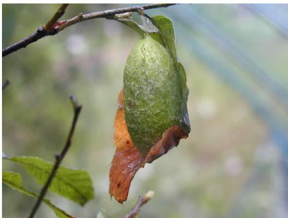
出沢やままゆ養蚕所