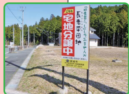
作手高原宅地分譲「長者平団地」