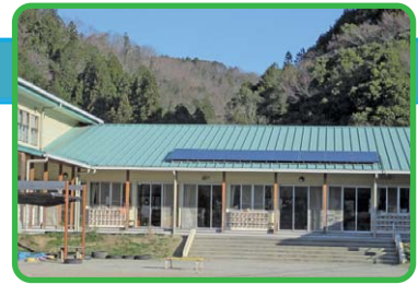
長篠こども園の太陽光パネル