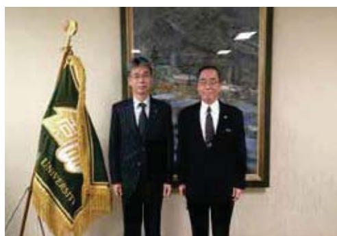
▲市長と東海国立大学機構の松尾清一機構長 (右)