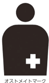
オストメイトマーク

外出時には、オストメイト対応トイレの利用が便利です。駅や公園などの公共施設、ショッピングモールなどの多機能トイレには、オストメイトマークが描かれています。貼替えに必要な物品を持ち歩くことで、漏れたときも安心です。