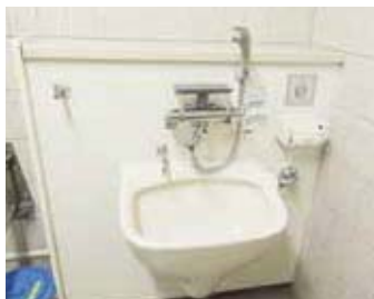
▲オストメイト対応トイレにはシャワー付き流し台、化粧鏡、カウンターなどの設備が整っています。