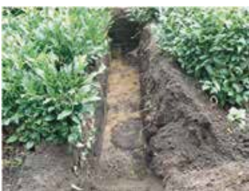
確認調査風景 (遺構：中央下の黒い円形箇所)

平成23年に市が実施した確認調査で、 当該期の遺物は出土しなかったものの、 主郭内には明瞭 な遺構を確認す ることができま した。今後、郷 土史の謎を紐解 くための考古学 的調査が持たれ ます。