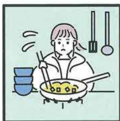
障がいや病気のある家族に代わり、買い物・料理・掃除・洗濯などの家事をしている