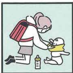
家族に代わり、幼いきょうだいの世話をしている