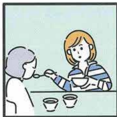
障がいや病気のある家族の身の回りの世話をしている