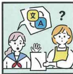
日本語が第一言語でない家族や障がいのある家族のために通訳をしている