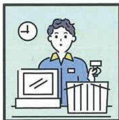
家計を支えるために労働をして、障がいや病気のある家族を助けている