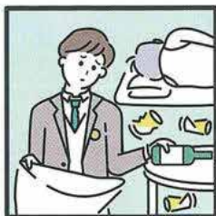
アルコール・薬物・ギャンブル問題を抱える家族に対応している