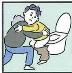
障がいや病気のある家族の入浴やトイレの介助をしている