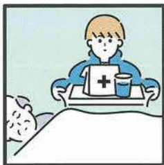
がん・難病・精神疾患など慢性的な病気の家族の看病をしている