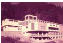
▲開館当時の鳳来寺山自然科学博物館