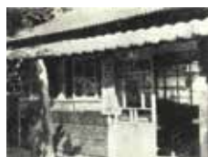
▲田口鉄道自然科学博物館