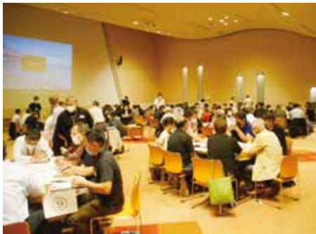
▲昨年度の市民まちづくり集会の様子