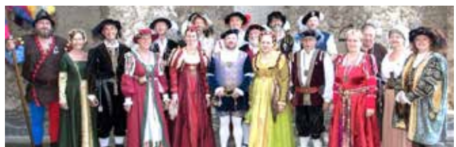
Neuburger Schliissfest