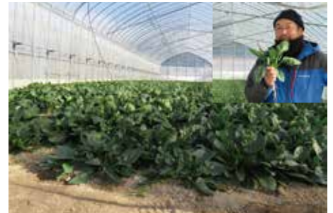
▲作手の奥三河ほうれん草

この地場産物を旬の時期に味わえるように、4月は新城市産の卵で「親子丼」、5月はしんしろ茶で「ちくわのしんしろ茶揚げ」、6月は作手産のほうれん草で「奥三河ほうれん草のみそ汁」を提供しました。給食の時間には、地域の生産者の方を紹介したり、本市で採れる旬の食材の特徴を伝えています。