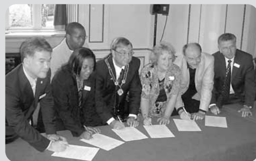
コミュニケーションに調印する各国の代表