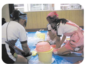
おいしい梅干を漬けるぞ