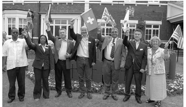
サミットオープニング

第5回世界新城サミットが、6月17日(土)から23日(金)までの7日間、イギリスのニューキヤッスル・アンダーライム市で開催されました。サミットには、穂積市長と随行の市職員1人がシンポジウムと市長会議に出席しました。市長会議では、ドイツのノイブルグ市から、2008年に「経済開発と再生」を主要テーマとするサミットを開催したいという申し入れがあり、各都市の市長が了承しました。