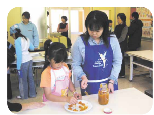
おいしい梅クッキーになったかな

11月には、梅の木学習の成果を「梅まつり」として発表する予定です。ここでは、地域の読み聞かせグループ「まほうのじゅうたん」や、地域の方を講師として「ふるさと学級」でお世話になった方などをお招きし、自分たちの取り組みを紹介したり、梅料理と一緒に作り出す予定です。