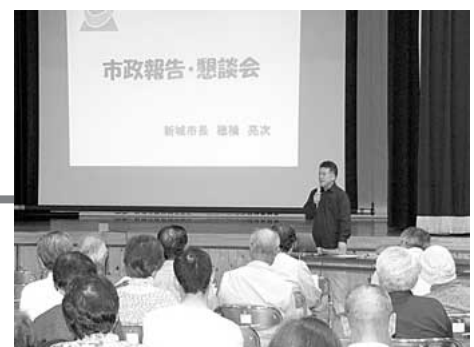
(鳳来開発センター)