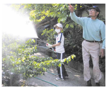
ただ今梅の実の消毒中

を、子どもたち自身で工夫させています。子どもたちは、海老地区全体の梅や、やっと育ってきた学校の梅畑にも学習の輪を広げています。