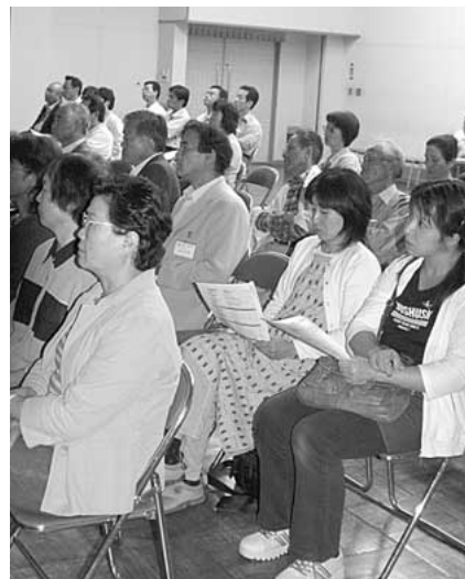
多くの女性参加者がありました (作手開発センター)

例えば、鳳来中学校屋内運動場は改築時期がせまっていますでしたが、財政状況が厳しく、見送らざるを得ませんでした。