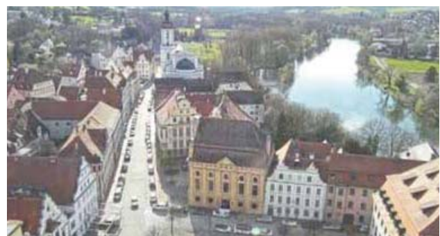
▲ライブ動画で見られるまちの様子