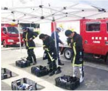
▲防火衣を着て出勤