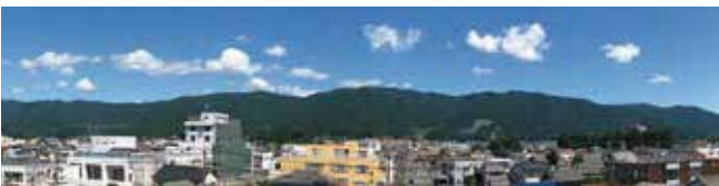
市役所から見た雁峰山