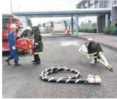
▲水利に到着し活動開始