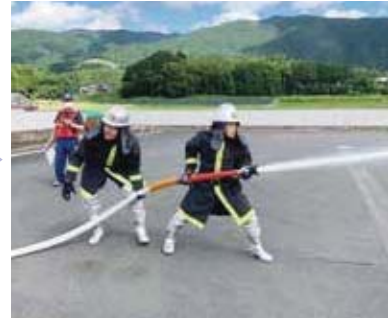
▲火点に向け放水開始

消防団員を募集してます。 興味のある方は、消防総務課(22-4803)へお気軽にお問い合わせください。