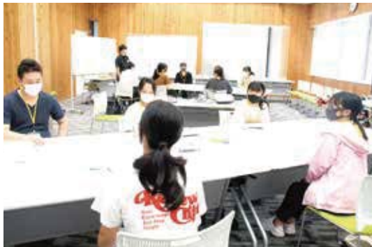
▲第1部 地域課題の解決方法を検討

平成24年度から始まった「中学生議会」を今年度は、より地域に密着した提案ができる場とし、モデル校に東郷中学校を選定し、勉強会、第1部、第2部と3部制で開催しました。 7月18日(日)の勉強会では地域の課題や取り組みについて勉強し、8月5日(木)の第1部では勉強会で学んだ地域の課題に対する解決方