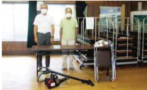
エアコン、掃除機、机、椅子など