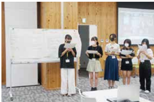
▲第2部 東郷地域協議会の方に発表

平成24年度から始まった「中学生議会」を今年度は、より地域に密着した提案ができる場とし、モデル校に東郷中学校を選定し、勉強会、第1部、第2部と3部制で開催しました。 7月18日(日)の勉強会では地域の課題や取り組みについて勉強し、8月5日(木)の第1部では勉強会で学んだ地域の課題に対する解決方