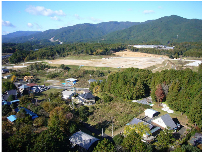
(新城インター企業団地1期事業完成写真)

新城インター周辺に企業立地のための工業用地造成を行い、企業誘致を進め雇用を確保し、地域産業の振興で賑わいを創出します。