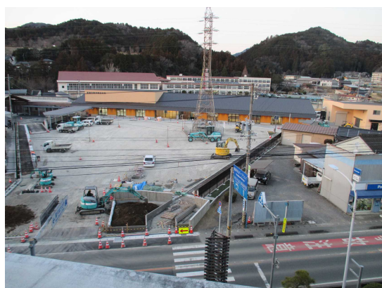
(工事中の新鳳来総合支所)

現在施工している鳳来総合支所建設工事、鳳来総合支所防災倉庫建設工事等は、令和5年2月末に完了する見込みです。